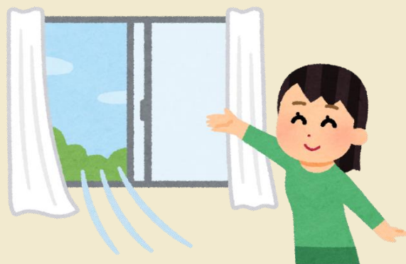
清掃時の客室内換気、スイッチ、ドアノブ、リモコン類の消毒