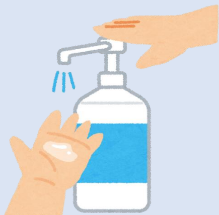
入店時の手指消毒