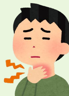
従業員の出勤時に徹底的な手洗い消毒、体温・体調のチェック